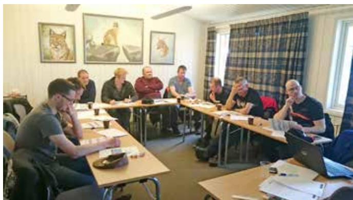
Teambuilding hos Bröderna Persson i Bredbyn.